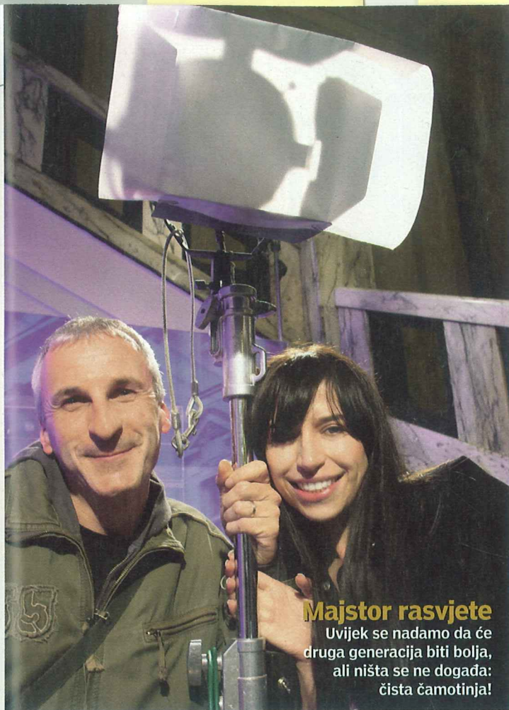
Majstor rasvjete Uvijek se nadamo da će druga generacija biti bolja, ali ništa se ne događa: čista čamotinja!