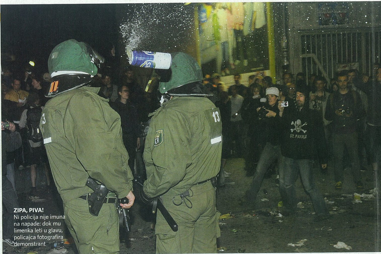
ZIPA, PIVA! Ni policija nije imuna na napade: dok mu limenka leti u glavu, policajca fotografira demonstrant