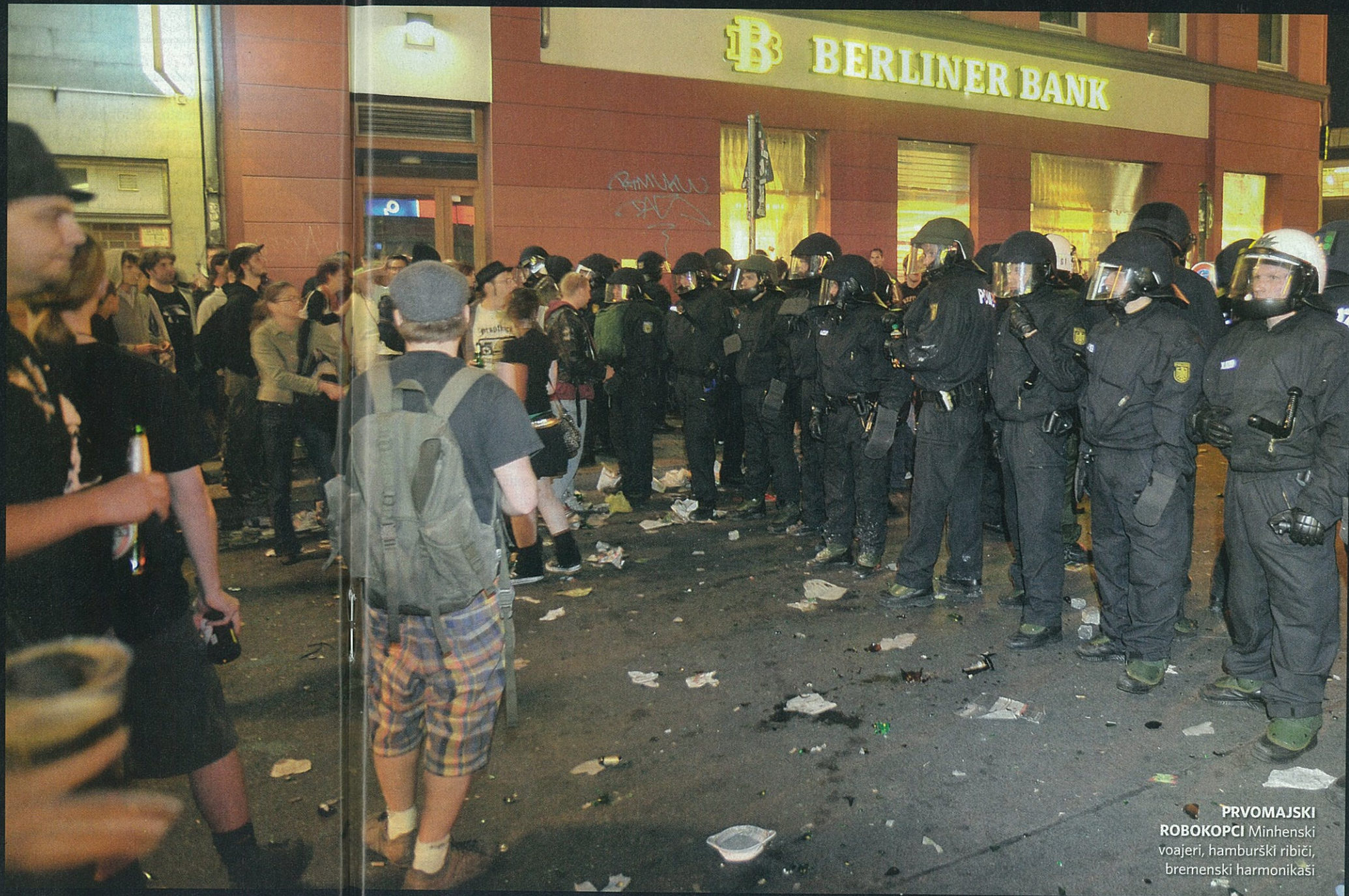
PRVOMAJSKI ROBOKOPCI Minhenski voajeri, hamburški ribiči, bremenski harmonikaši

grad koji uporno, već 35 godina, dobrovoljno sam sebe razbija. Jer i ja imam isti slučaj, svako malo si kažem: "Uf, al sam se jučer totalno razbila." To razbijanje je toliko očaravajuće da ja dobro razumijem kako Berlin bez njega više ne bi bio baš svoj. Ude ti to pod kožu, postane tradicija, folklor - štoviše smotra folkloru prema kojoj je ona zagrebačka tek mala beba. U povjerenju, htjela sam u taj Berlin i zato što je već svaka šuša u njemu bila. Tako još jednom tuđa tradicija odigra važnu ulogu u mom životu, tako još jednom tradiciju totalno prilagodim sebi. >>