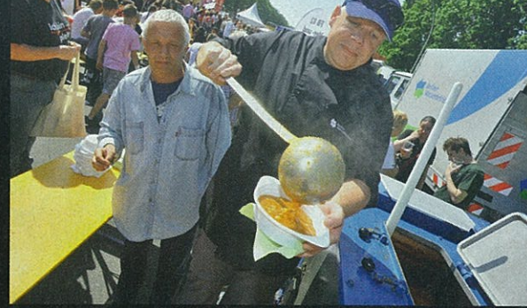
NAKON POVORKE S TRANS PARENTIMA Prvomajski grašak koji služe po Berlinu nije ni sluga zagrebačkom grahu