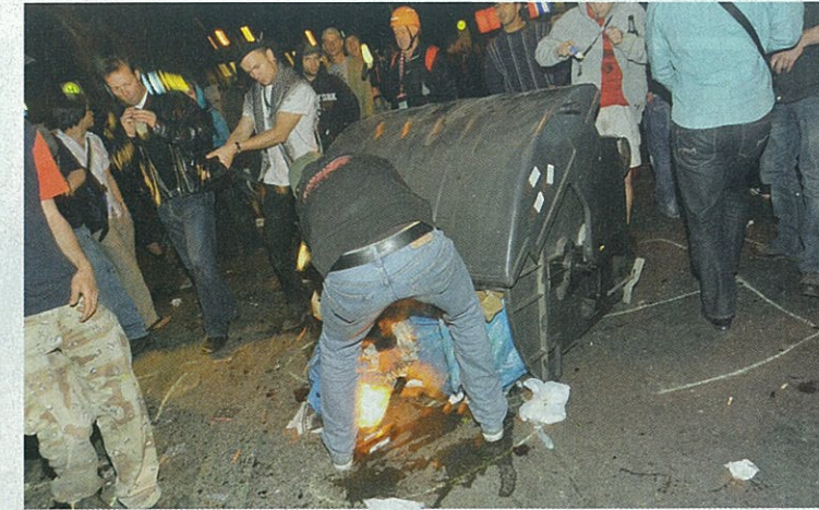
BAKLJADA Dodeš u Berlin i radiš sve ono što ne možeš kod kuće: recimo, pališ kontejnere, razbijaš automobile, bacaš kamenje na robokopce