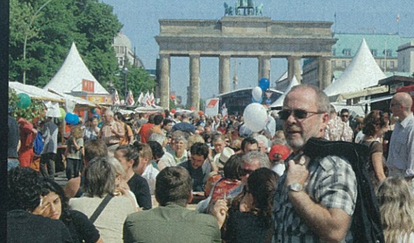
I STARO, I MLADO Demonstracije tradicionalno počinju pred Brandenburškim vratima i nastavljaju se ulicama grada