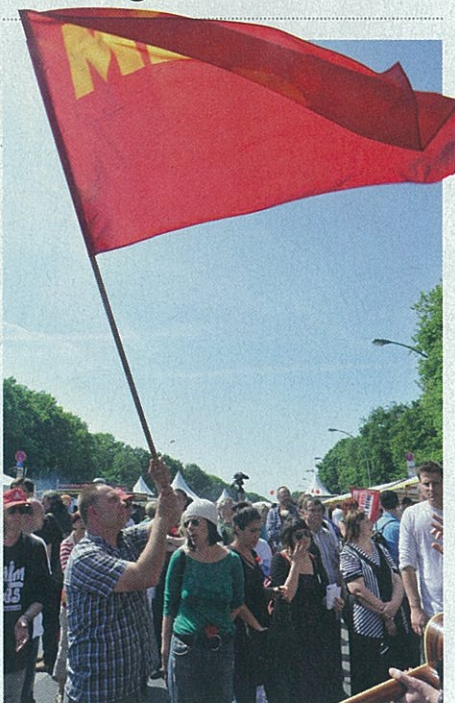
ZASTUPNICI LJEVICE Marksističko-lenjinstičko-trockističko-maoistička partija

Kupujem od Indijca vizu kao da bez nje ne mogu kroz Brandenburška vrata, a mogu. Kakvu to igru sa sobom igram dok tek učim da se treba živjeti bez granica?