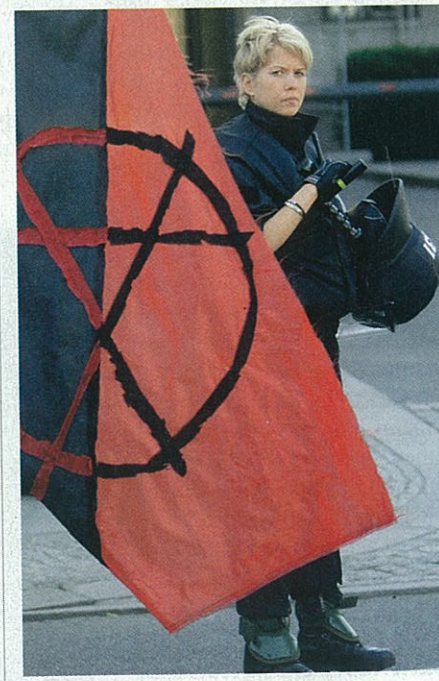
SNAGE REDA Policajka čuva povorku koja je pješačila od Prenzlauerberga do X-berga