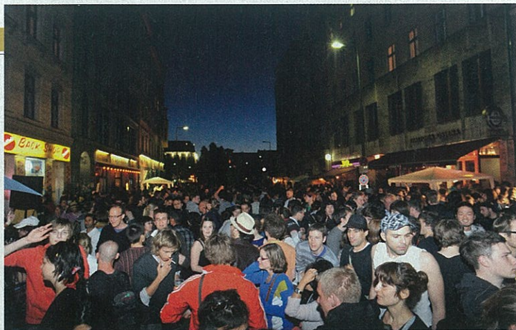
BALKAN JE IN DJ Cigan Aldi pušta balkanski blues na koji okupljena gomila reagira odlično: oko DJ pulta brzo se okupljaju znatizeljnici